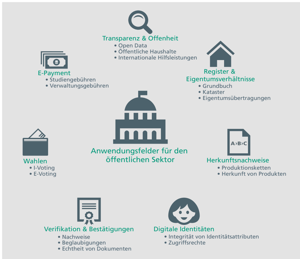
Abb. 3: International häufig diskutierte Anwendungsfelder der Blockchain-Technologie [17]

Der offensichtliche Anwendungsfall des E-Payment ist dabei ebenso trivial wie einfach realisierbar. Ein Beispiel findet sich etwa in der schweizerischen Stadt Zug, in der Bitcoin als Zahlungsmittel für Verwaltungsgebühren akzeptiert werden. Ein Dienstleister, der die Bitcoin noch am selben Tag in Schweizer Franken umtauscht, verringert für die Verwaltung das Risiko allzu großer Kursschwankungen.