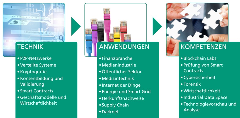
Abb. 1: Technik, Anwendungen und Kompetenzen aus Sicht der Fraunhofer-Gesellschaft

Dieses Positionspapier analysiert die Blockchain-Technologie aus wissenschaftlicher und anwendungsorientierter Sicht der Fraunhofer-Gesellschaft. Es untersucht relevante Technikaspekte und damit verbundene Forschungsfragen. Dabei zeigt sich, dass die Technik in allen Bereichen noch grundlegende Forschungs- und Entwicklungs-Herausforderungen aufweist. Diese liegen beispielsweise in der Modularisierung einzelner Blockchain-Konzepte sowie deren Kombination und Integration für anwendungsspezifische Blockchain-Lösungen.